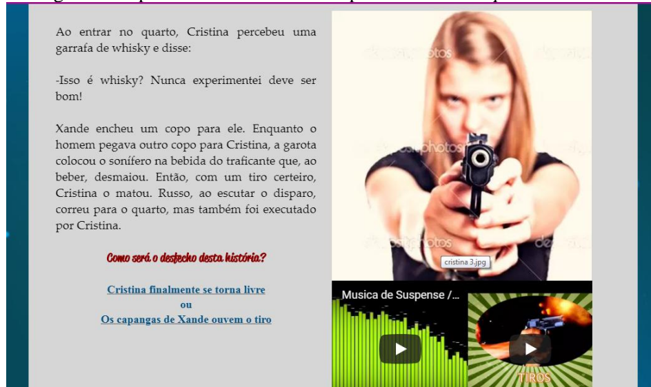
Figura 5: Captura da terceira tela do hiperconto Um tiro para a liberdade