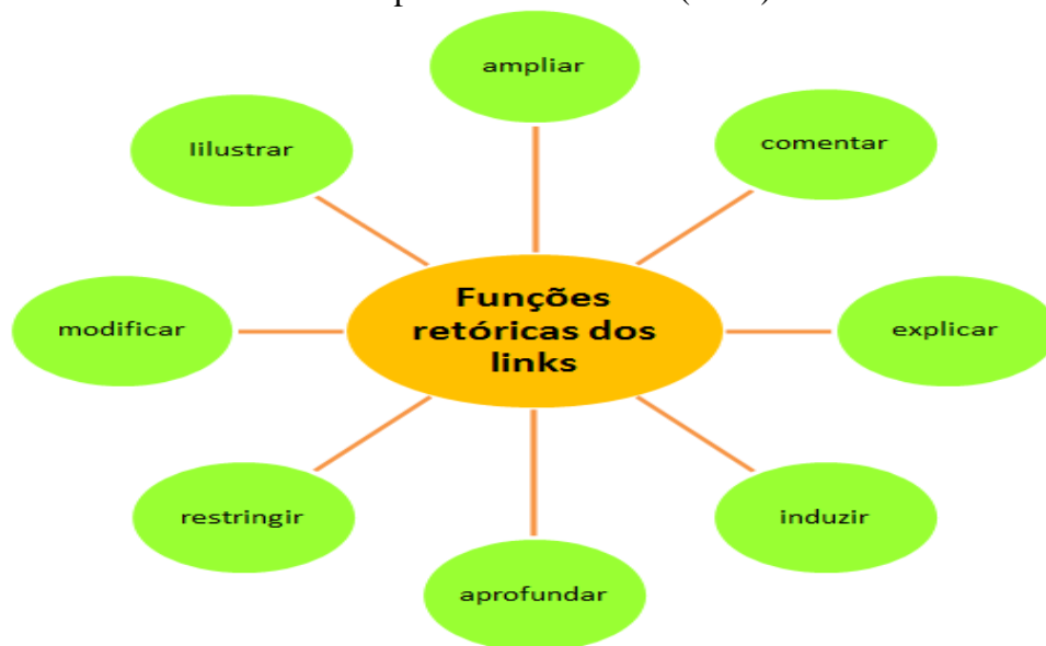
Figura 3: Diagrama representativo das funções retóricas dos links , em conformidade com a compreensão de Gomes (2011)