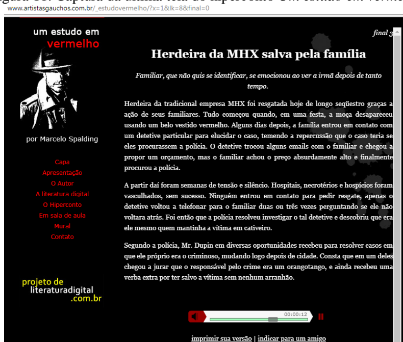
Figura 11: Captura da última tela do hiperconto Um estudo em vermelho