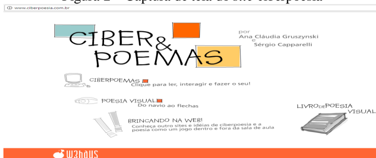
Figura 2 – Captura de tela do site ciberpoesia