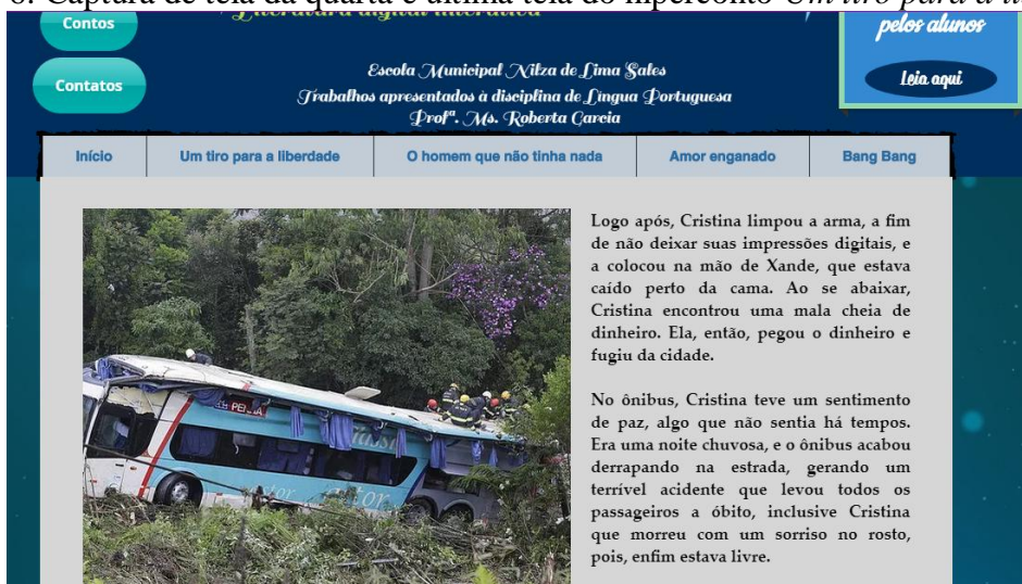
Figura 6: Captura de tela da quarta e última tela do hiperconto Um tiro para a liberdade