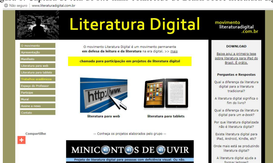
Figura 1: Captura de tela do site mais conhecido do Brasil sobre literatura digital